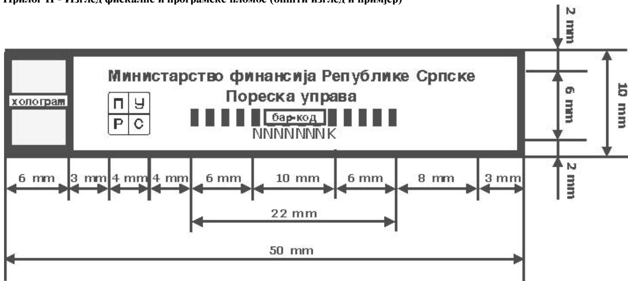
Слика 3. Општи изглед фискалне пломбе