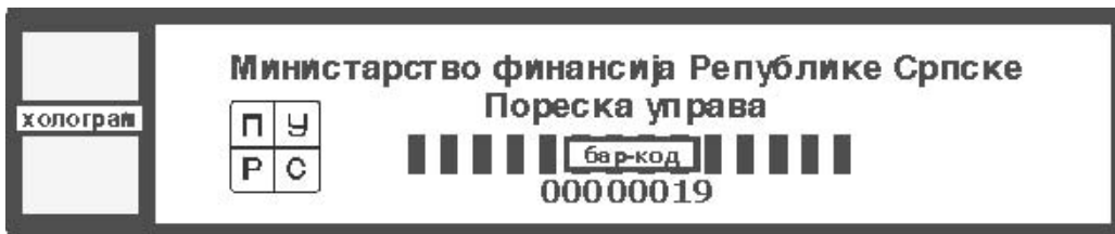
Слика 4. Примјер фискалне пломбе са најнижим серијским бројем